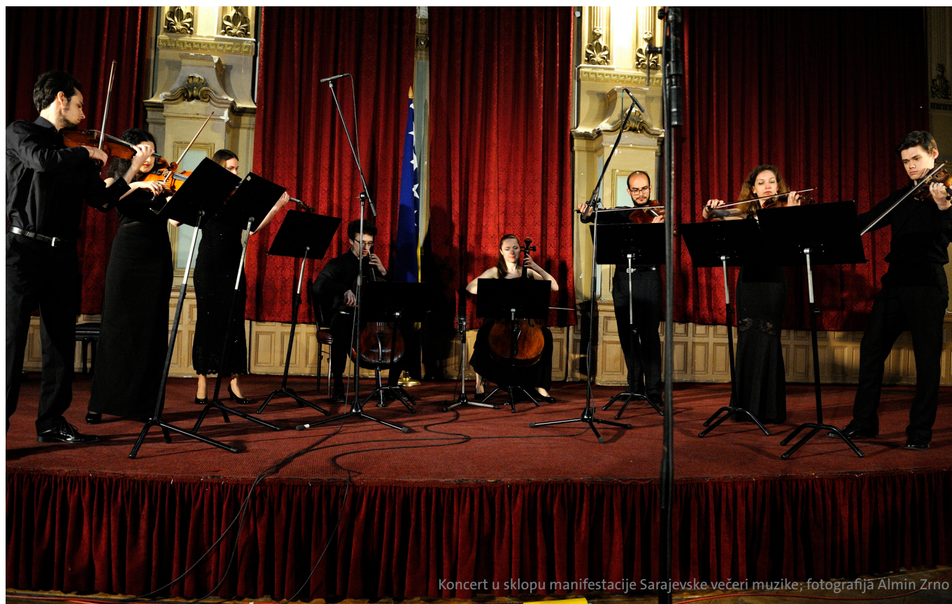
Koncert u sklopu manifestacije Sarajevske večeri muzike

Dane arhitekture, svečano otvorene izložbom „Mladi arhitekti iz Beča“ 19. maja u sarajevskoj Vijećnici.