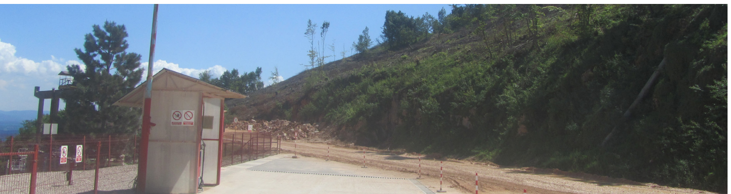
Sječa šume za novu trasu puta