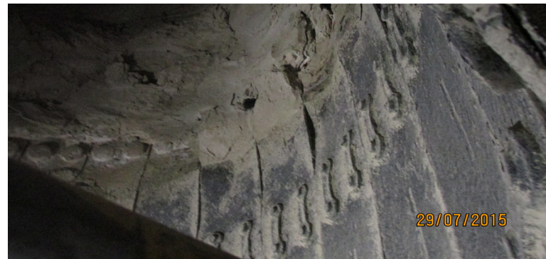
Uronjena cijev C4- Stari KHD dizajn

Nakon puštanja u rad vertikalnog mlina sirovine 2, praćen je njegov rad, a posebna pažnja je posvećena stanju točkova i staze za mljevenje. Vrijednosti mjerenja iz prošle godine su iziskivali poduzimanja određenih koraka – kupovinu novih točkova i staze za mljevenje ili njihova reparacija.