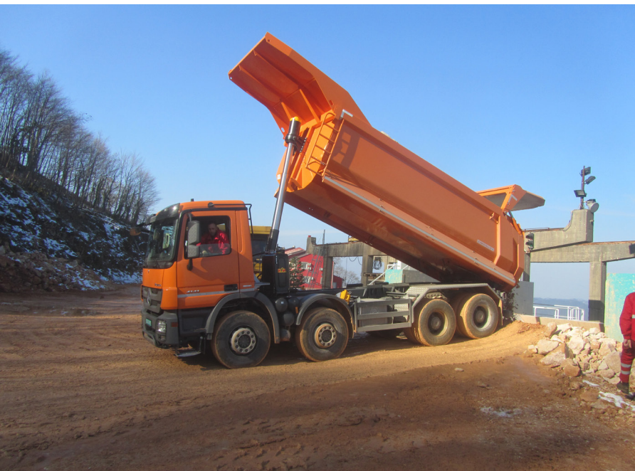
Novi kamion Mercedes

Nakon pribavljanja svih potrebnih dozvola, izvršeno je i krčenje 4 hektara šumskog zemljišta unutar odobrenog eksploatacionog polja. Svrha ove aktivnosti je proširenje i nastavak eksploatacijskih radova i trasiranja kraćeg puta od kamenoloma do separacije, što će dužinu kamionskog transporta kamena skratiti za oko 50%.