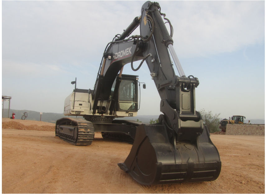
Novi bager HIDROMEK

Proizvodnja se sada vrši sa novom čeljusnom drobilicom većeg kapaciteta, koja je nabavljena i montirana u prošloj godini.