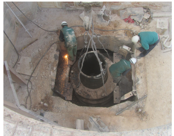
Demontaža stare drobilice

Nakon pribavljanja svih potrebnih dozvola, izvršeno je i krčenje 4 hektara šumskog zemljišta unutar odobrenog eksploatacionog polja. Svrha ove aktivnosti je proširenje i nastavak eksploatacijskih radova i trasiranja kraćeg puta od kamenoloma do separacije, što će dužinu kamionskog transporta kamena skratiti za oko 50%.