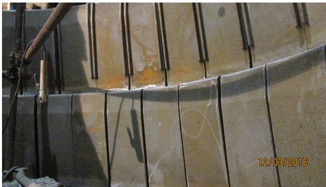
Uronjena cijev C4-novi dizajn

Na osnovu dosadašnjih iskustava u radu uz korištenje alternativnih goriva na izmjenjivaču toplote, služba MGO se oprijedijela da izvrši određene modifikacije na postojećoj opremi. Obzirom da je uočeno i povećano trošenje uronjene cijevi, izvršena je modifikacija rješenja. Izmjenama smo postigli dobre rezultate, a stanje ovog dijela pogona ćemo nastaviti pratiti. Pored ove modifikacije, već ranije su poduzete mjere na vatrostalnom materijalu u ciklonu C5, a u pripremi su rješenja i za ostala kritična mjesta.